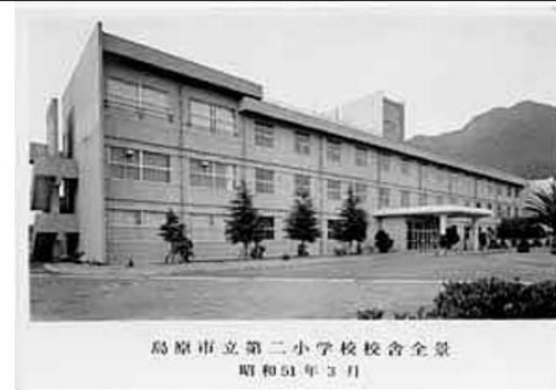
島原市立第二小学校